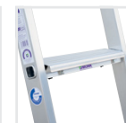
Stufenmodul MaxxStep Bestell-Nr. 19901 - 19905