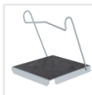
Einhängetritt R13 Bestell-Nr. 19910