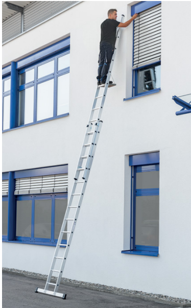
Abb. Bestell-Nr. 11613 mit Best.-Nr. 19910