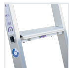
Stufenmodul MaxxStep Bestell-Nr. 19901 - 19905