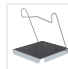
Einhängetritt R13 Bestell-Nr. 19910